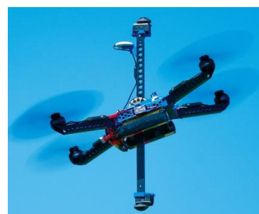
エアロネクスト社製 4D GRAVITY®搭載ドローン